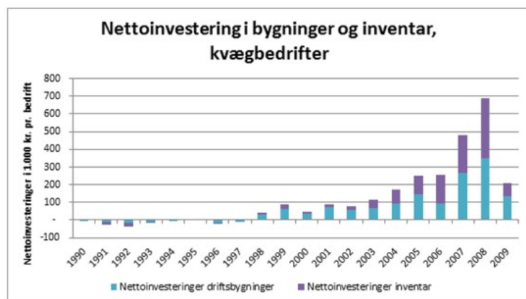
Figur 1. Nettoinvestering i bygninger og inventar på kvægbedrifter fra 1990 til 2009

Et andet forhold, som det er nødvendigt at forholde sig til, er udviklingen i nettoinvesteringerne i de foregående år. Hvordan er der investeret i de seneste 5 år? Og hvordan ser det ud med de seneste 20 års investeringer?